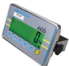
Indicador AE 402