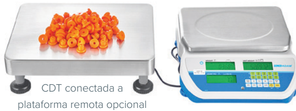
CDT conectada a plataforma remota opcional