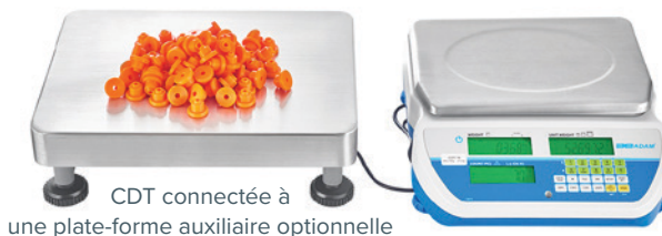
CDT connectée à une plate-forme auxiliaire optionnelle

les imprimantes et les ordinateurs, pour une intégration intuitive dans les systèmes secondaires. Les utilisateurs peuvent stocker et rappeler jusqu'à 100 articles dans la mémoire de la CDT pour la gestion des pièces fréquemment utilisées. La batterie interne rechargeable permet d'utiliser la balance n'importe où, même en l'absence de courant.