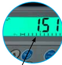
Indicateur de capacité