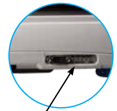
RS-232 bidirectionnelle 1